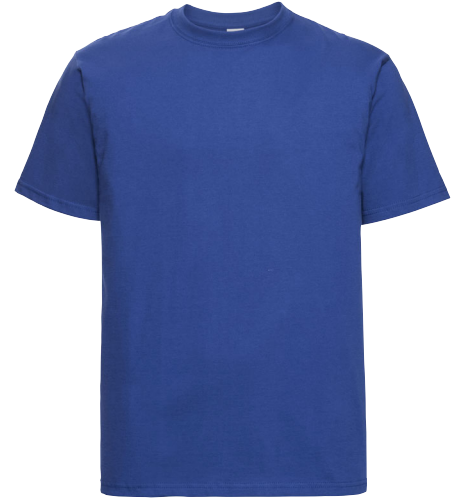
215M Classic Heavyweight T SIZE S-2XL